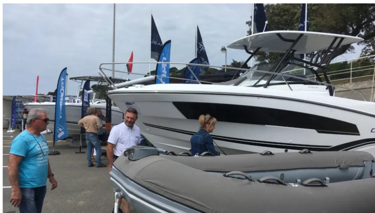
Des bateaux en exposition au salon nautique de Pornic (Loire-Atlantique).

C'est une première à Pornic (Loire-Atlantique). Un salon nautique ouvre ses portes tout le week-end du 13 au 15 mai sur le parking du port de la Noëveillard. Au total, une vingtaine d'exposants, tous issus du monde de la plaisance.