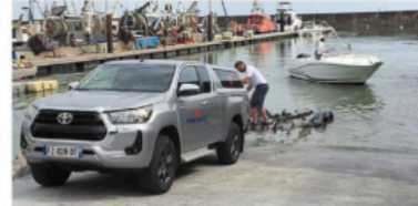
Un bateau mis à l'eau lors de l'inauguration de la cale.