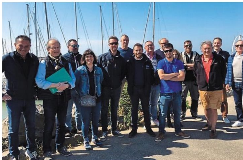
Une partie de l'équipe organisatrice s'est réunie au port de la Noëveillard, à Pornic, pour préparer le premier salon nautique, avec une belle énergie collective.

« Des ateliers seront animés, des sorties découvertes en mer organi-