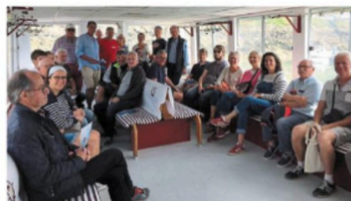
Les séquences de Navicoach dédiées à l'école en mer ont rencontré un fort succès.