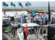
Avec le soutien de la Ville de Pornic et du port représenté par Loire-Atlantique Nautisme, le village nautique installé à côté de la plage de la Noëveillard a reçu de nombreux visiteurs pendant trois jours, sous un soleil éclatant.

Pays de Retz — Les professionnels du nautisme et les commerçants ont su capter le public lors du premier salon nautique de Pornic, organisé en deux mois par la nouvelle association Nauta Bene.