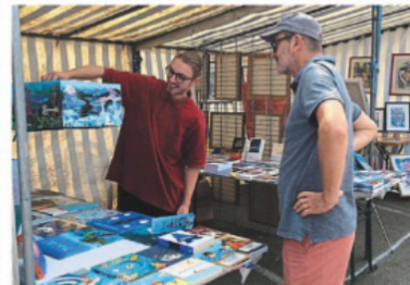
La librairie l'Encre Bleue avait installé deux grandes tables emplies de livres pour petits et grands. Isabelle Autissier, Bernard Moitessier, Florence Artaud, et autres auteurs figuraient parmi les ouvrages proposés aux amoureux d'aventures en mer.