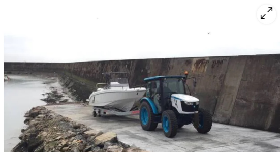
La cale de la Noëveillard sera officiellement inaugurée samedi prochain.

Le syndicat mixte Les Ports de Loire-Atlantique vient de terminer la rénovation et la remise en service de la cale de mise à l'eau de la digue ouest du port de la Noëveillard, à Pornic .