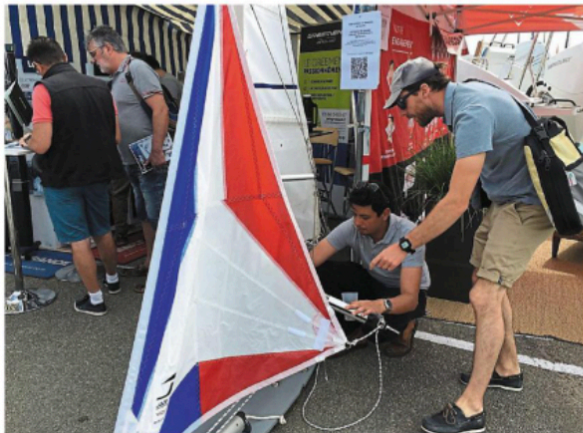
Explications techniques devant le stand Jade Gréement et Jade Voiles.